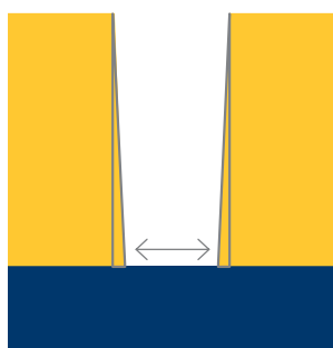
Orbotech Ultra PerFix 170i