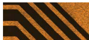
シェイピング後 白色光画像