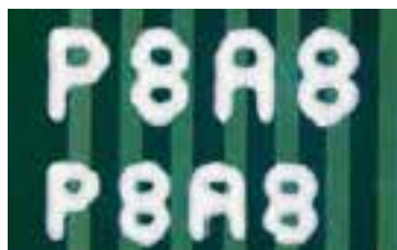
DotStream Proテクノロジーでの0.7mmおよび0.6mmのテキスト印刷 印刷モード: 1パス、印刷時間: 15秒** (Orbotech Sprint 200)