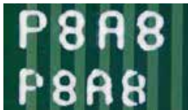
従来モデルでの0.7mmおよび0.6mmのテキスト印刷 印刷モード: 1パス、印刷時間: 26秒**